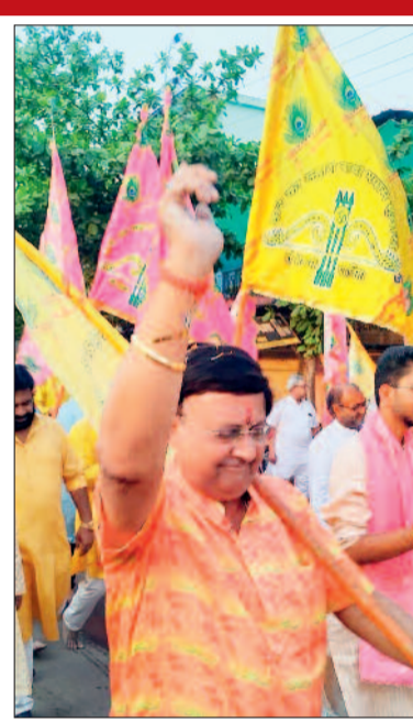
श्याम भजन संध्या का आयोजन किया गया।

फागुन माह की पावन बेला पर श्री श्याम परिवार एवं अग्रवाल नवयुवक मंडल के तत्वावधान में भव्य निशान यात्रा का आयोजन किया गया। पूरे शहर में भक्तिमय वातावरण के बीच श्रद्धालुओं की टोली हाथों में पवित्र निशान लेकर भजन गाते और जयकारे लगाते हुए नगर भ्रमण पर निकलीं। इसमें सभी श्याम भक्तों ने हिस्सा लिया। हारों के सहारे, श्याम हमारे और जय श्री श्याम के उदघोष से शहर का वातावरण गुंज उठा। महिलाएं, युवा और बच्चे पारंपरिक वेशभूषा में शामिल हुए, जिससे यात्रा का दृश्य अत्यंत आकर्षक और भावपूर्ण बन गया। नगरवासियों ने निशान यात्रा का स्वागत किया। फागुन माह में श्याम भक्तों के लिए निशान यात्रा का विशेष धार्मिक महत्व माना जाता है। मान्यता है कि इस माह में सच्चे मन से की गई पूजा-अर्चना और निशान अर्पण से खाटू श्याम की विशेष कृपा प्राप्त होती है। इसी आस्था के साथ भक्तजन बड़ी संख्या में शामिल हुए और पूरे मार्ग में भक्ति रस की अविरल धारा बहती रही। निशान यात्रा के समापन पश्चात श्री राधाकृष्ण मंदिर में भव्य