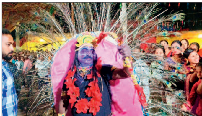
हरिभूमि न्यूज >>> मैनपुर

गरियाबंद जिले से सटे कालाहांडी जिले का मथुरा गांव इन दिनों अपनी सदियों पुरानी फागु दशमी और फागु यात्रा परंपरा को लेकर एक बार फिर चर्चा में है। यह आयोजन केवल धार्मिक अनुष्ठान भर नहीं, बल्कि ग्रामीणों की सामूहिक आस्था, सांस्कृतिक चेतना और परंपराओं को संरक्षित रखने की जीवंत मिसाल है। होली से चार दिन पूर्व फागु दशमी के दिन से आरंभ होने वाला यह महोत्सव आज भी उसी मूल स्वरूप में आयोजित किया जाता है, जैसा वर्षों पहले पूर्वजों द्वारा स्थापित किया गया था। उत्सव की शुरुआत भगवान राधा कृष्ण की विधिवत पूजा-अर्चना से होती है। पूजा के पश्चात उन्हें सुसज्जित झूले में विराजित कर झुलायौ। प्रतिदिन प्रातः भगवान पूरे गांव का परिक्रमण करते हैं, जिससे पूरा वातावरण भक्ति और श्रद्धा से ओत-प्रोत हो उठता है। ग्रामीण पारंपरिक वेशभूषा में शामिल होकर इस दिव्य यात्रा का हिस्सा बनते हैं। झूला उत्सव के बाद आरंभ होता है सांस्कृतिक कार्यक्रमों का अद्वितीय सिलसिला, जिसकी सबसे